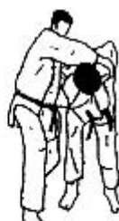
ude garami opwaarts