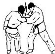
ude garami neerwaarts