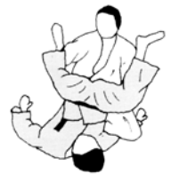
PASSEREN UKE RUGPOSITIE