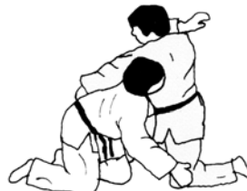
INTERACTIE/REAGEREN OP UKE

Ude kantsetsu-waza = armklemtechnieken - hisihigi-gatame groep = gestrekte controle - met lies = juji (gekrust) gatame - met oksel = waki-gatame - met arm = ude gatame - met knie = hiza-gatame - met buik = hara gatame - ude-garami groep = arm verdraaien Armbevrijding bij uke als deze verdedigt. Elke techniegroep vanuit verschillende posities interactie/reageren op partner