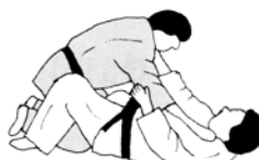
POSITIE TORI OF UKE OP RUG