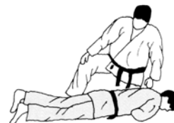
POSITIE UKE OP BUIK