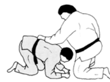
POSITIE UKE BOK